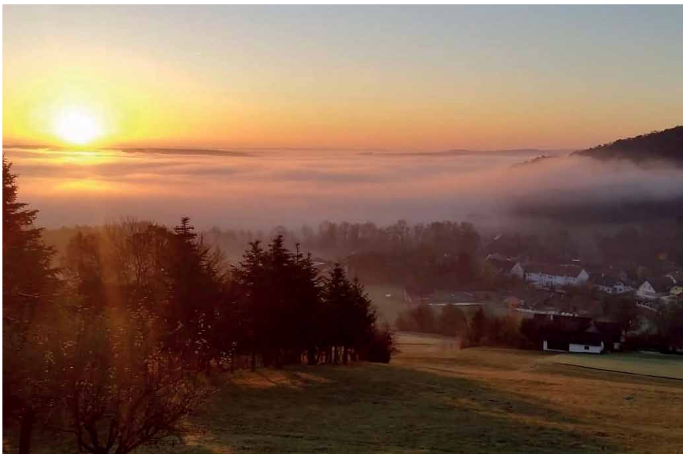
Blick von Staudach Greith nach Penzendorf