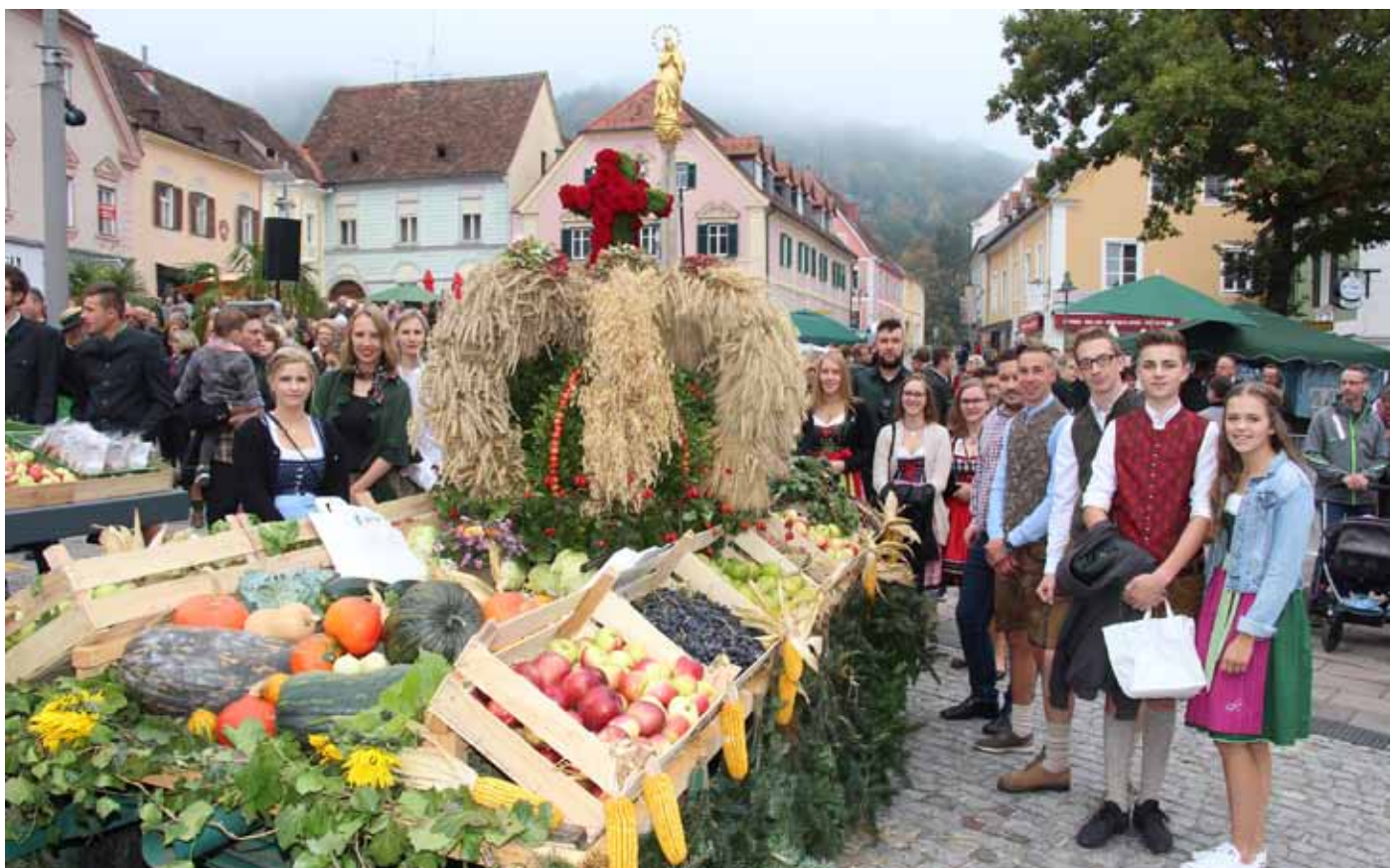
Erntedank 2018 - Hartberg