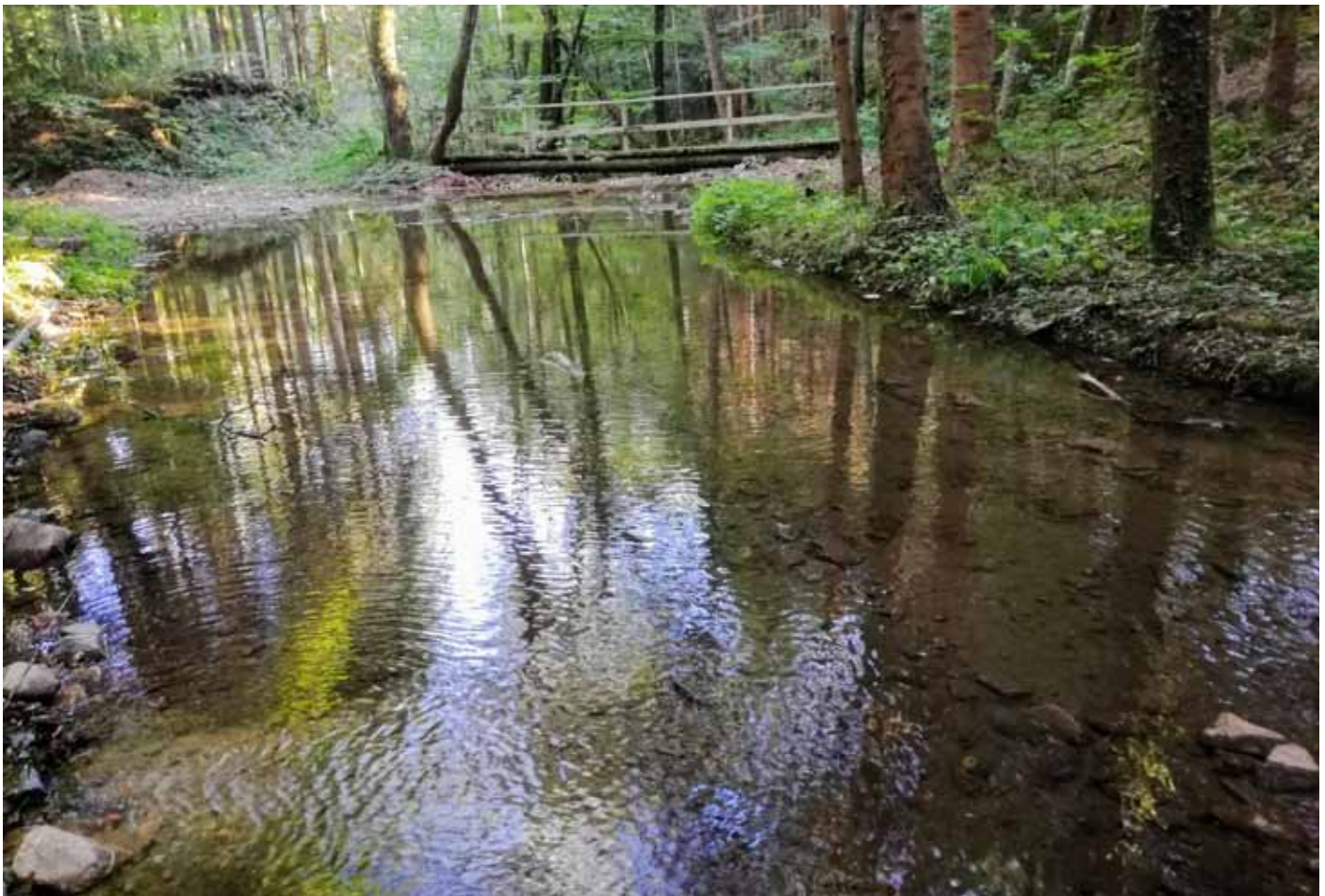
Pachinger Bach - Staudach