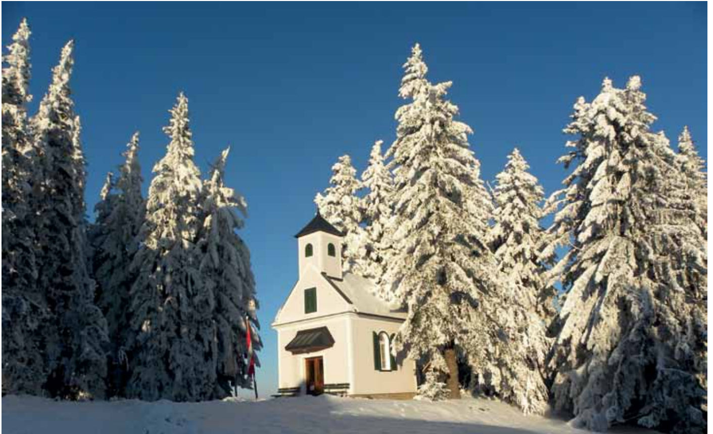
Glückskapelle - Masenberg