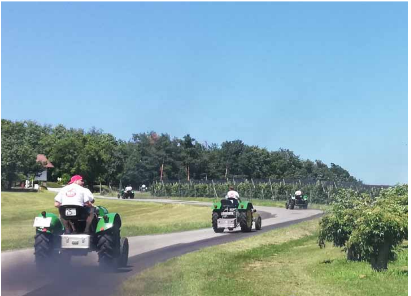
Oldtimerausfahrt - Staudach Greith