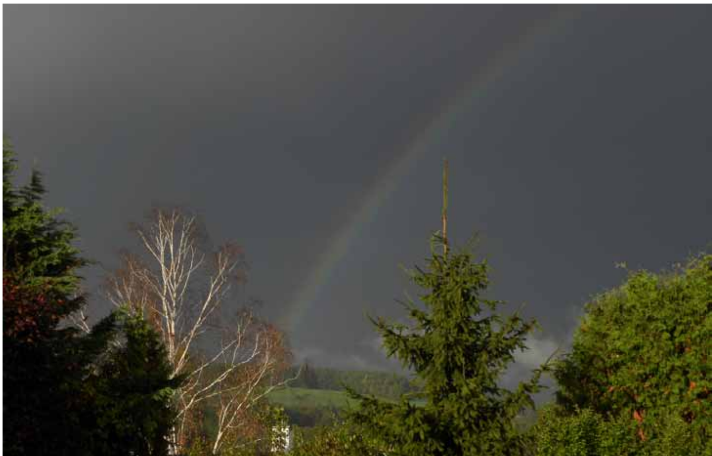
Gewitterwolken - Staudach Siebenbirken