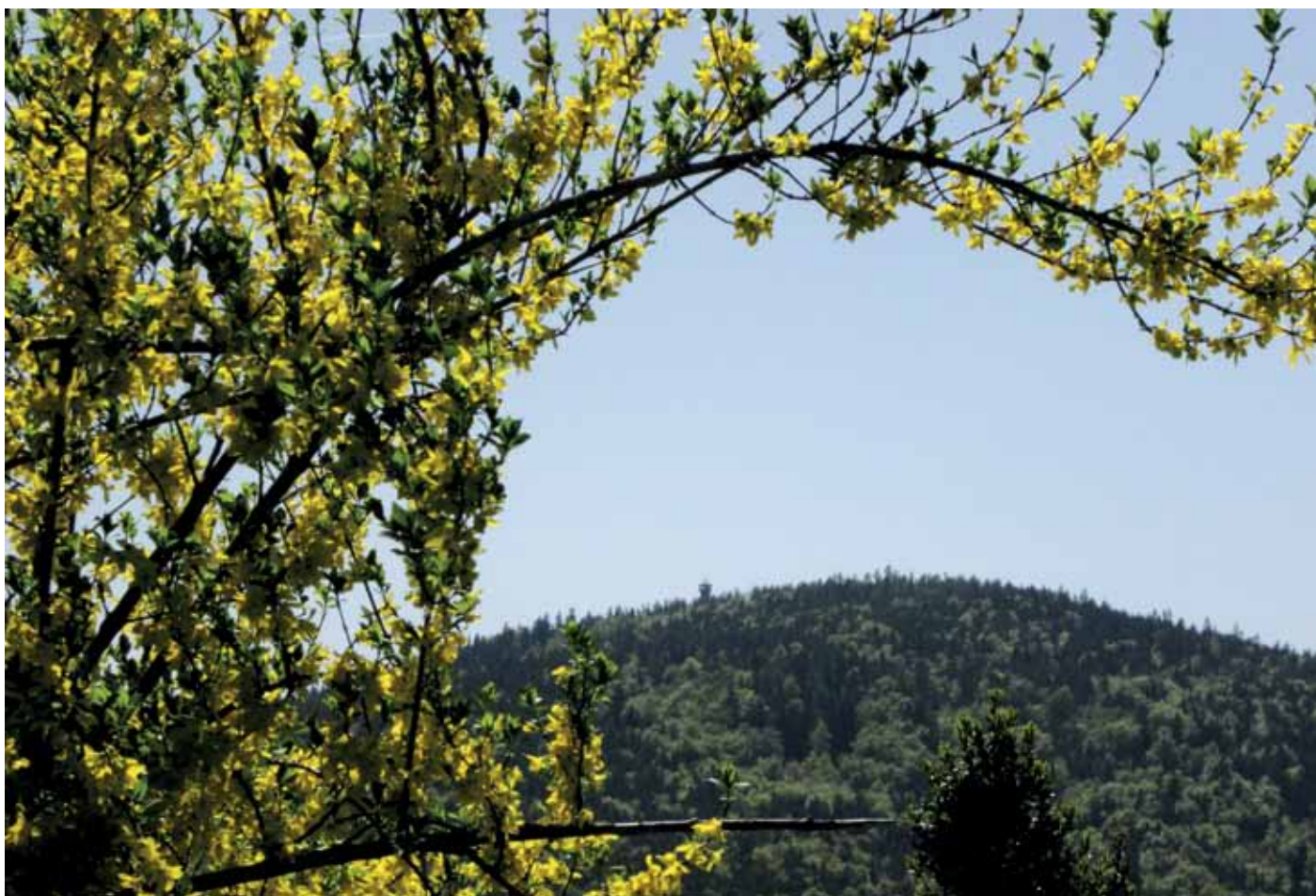
Blick zur Ringwarte