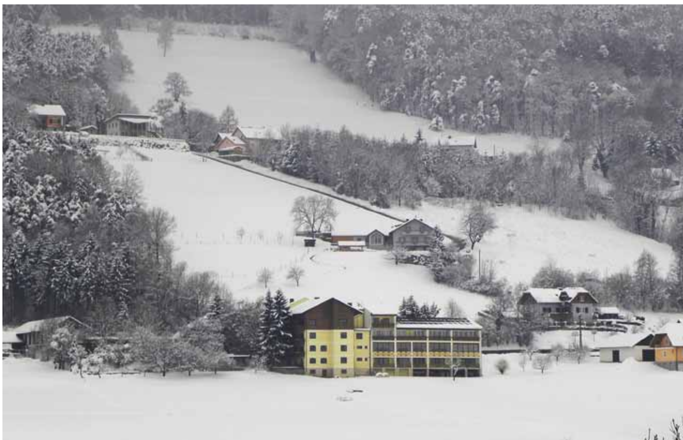
Winterstimmung in Penzendorf