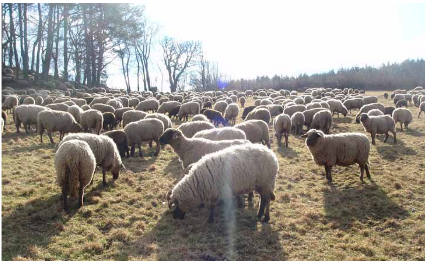
Schafherde - Staudach Greith